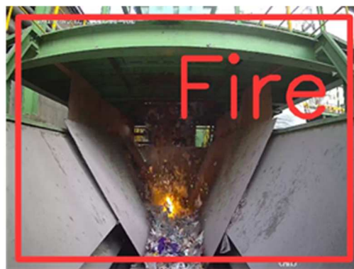
(左) リチウムイオン電池破碎時の瞬間 (右) システムによる火花検知の様子